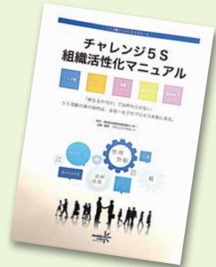
「チャレンジ5S 組織活性化マニュアル」 10,800円(税込) 5S活動のノウハウを1冊に集約。事例豊富で実践型のマニュアル。