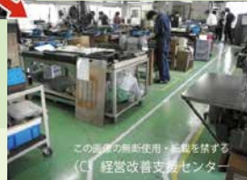
この画像の無断使用・転載を禁ずる (C) 経営改善支援センター