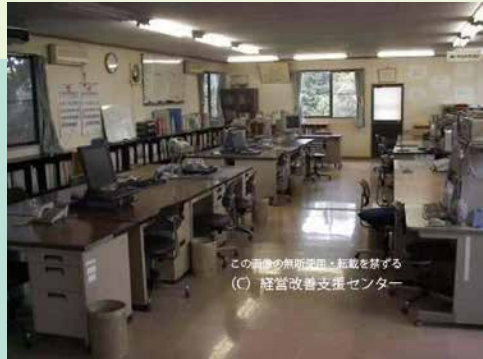
この画像の無断使用・転載を禁ずる (C) 経営改善支援センター