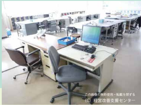
この画像の無断使用・転載を禁ずる (C) 経営改善支援センター