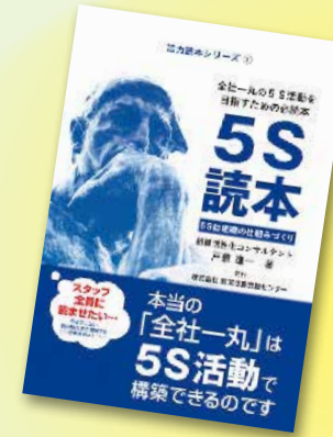
「活力読本シリーズ1 5S読本-5Sは組織の仕組みづくり-」 800円(税込) 現代書林刊