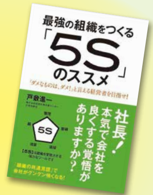
「最強の組織をつくる『5S』のススメ」 1,400円(税別) 現代書林刊

講演会の他に、毎週月曜日に5S活動のもと、悩みや不安に耳を傾ける時間を作りました。