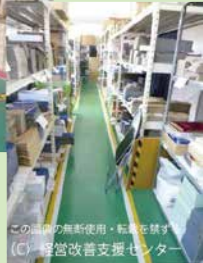
この画像の無断使用・転載を禁ずる (C) 経営改善支援センター