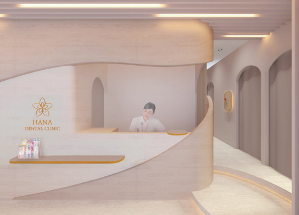
設計デザイン: 株式会社 空画 / 施主: HANA DENTAL CLINIC (久喜市)