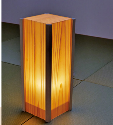
紗艶空(さえんもく) ライトスタンド

紗艶空とは、鉋(かん)で木材の表面を極限まで薄く削った皮膜を独自工法によって丹念に加工した「温かく自然に透ける板」のこと。使用する木材は、熟練の職人が選定し、空目の模様が一番美しくなるように完成状態から逆算して採寸や切り出しを行う。明かりを灯していない状態でも木目の模様を楽しめる。