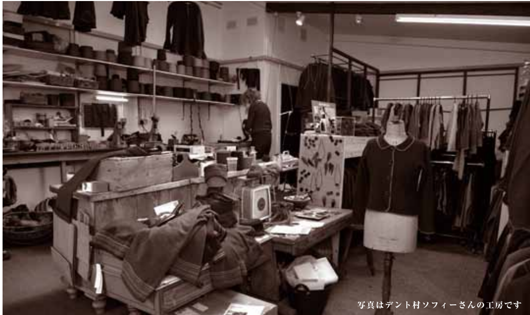
写真はデント村ソフィーさんの工房です