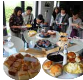
(イメージ:アフタヌーン・ティー)

ケーキやサンドウィッチを紅茶と一緒に。好天なら家庭的アフタヌーンティーを花咲く綺麗な庭でいただきます。