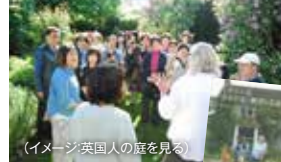
(イメージ:英国人の庭を見る)