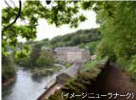
(イメージ:ニューラナーク)

クライド川沿いにある綿紡績工場跡。ロバート・オウエンも力添えた世界遺産を訪れ工場労働者の住宅など見学。