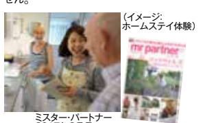
(イメージ:ホームステイ体験)

一般のご家庭にホームステイすることで、英国人により密接に交流する機会に。英語がほとんど話せなくても心配はいりません。