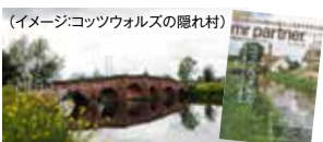
(イメージ:コッツウォルズの隠れ村)

古代の神秘的な丘ブリードン・ヒル周辺には素敵な村々が点在しています。コッツウォルズ地方ならではの村に出合えます。