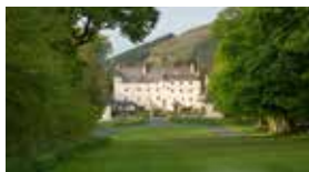
(イメージ:トラクエアハウス)