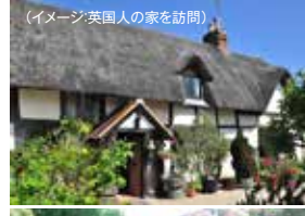
(イメージ:英国人の家を訪問)