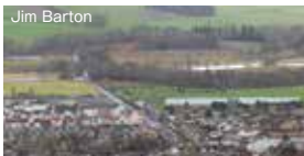
(イメージ:イナリーセンのニット)

ボーダー地方イナリーセンでインターシャという編み技法を引き継ぐ職人の工房見学。エール醸造所のある貴族の館「トラクエア・ハウス」に宿泊。