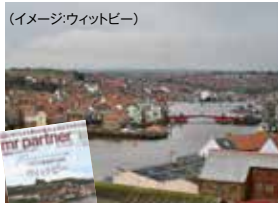
(イメージ:ワイトビー)

作者ブルーム・スターカーがドラキュラの着想を得た199階段やワイトビー修道院跡、キャプテン・クックで有名な港町。旧市街散策&ショッピング。