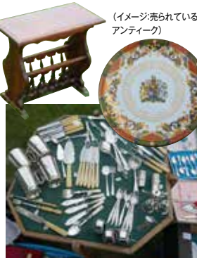
(イメージ:アンティーク・フェア)

スタンフォード・メドウで開催される大規模なアンティークフェアへ訪れアンティークハンティングを楽しみます。