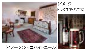
(イメージ:ジャコバイトエール)