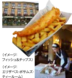
(イメージ:フィッシュ&チップス)

独自のバターで揚げた受賞歴のあるフィッシュ&チップスは地元リピーターも多く絶賛されています。