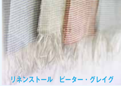
リネンストール ピーター・グレイグ