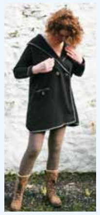
⑥ソフィース・ワイルド・ウールズ 第1会場

ツイードコートドレスやソフィアボタンジャケットも! 伝統をかたちにしたハムステッドワンピース、手描きイラストがレトロなPALAVAのドレスも春色登場!