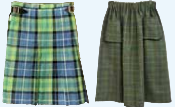
②エディンバラのタータン 第2会場