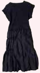
シルクワンピース (富士吉田)

東ロンドンで人気のキャシのコートやドレス。英国の古着も! 可憐なヴィンテージ。一枚でも着られる楽ちんなシルクワンピースも!