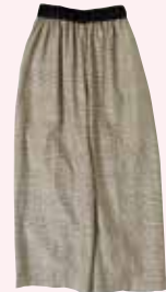
④エブリマンエブリマン エドワードアンパンツ