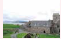
キリスト教伝来のアイオナ島