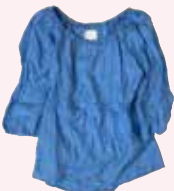
①スージーハーバー シルクトップ&コットンシャツ

東ロンドン、そしてハムステッドで作られるロングセラー。古典的で生地にこだわる春夏の麻混コートドレスも必見です。