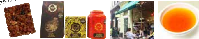
左からスコーン (蔵クッキング) / ここだけのラインナップ ⑤カメリアズ・ティーハウス・ブレンドティー(ロンドン)

缶入りも登場! ゴールドアワード受賞のカメリアスティーや テラカドのケーキとリッチなティータイムを!