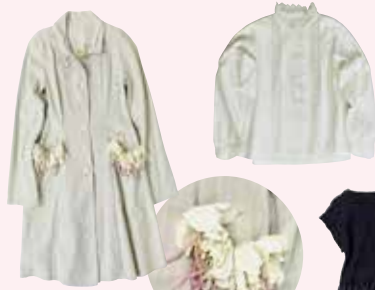
ロンドン新鋭デザイナーコレクション & ヴィンテージ

東ロンドンで人気のキャシのコートやドレス。英国の古着も! 可憐なヴィンテージ。一枚でも着られる楽ちんなシルクワンピースも!