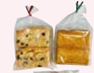
New テラカドのレモンケーキ、 ブルーベリーケーキ

ヨークシャーの老舗織り工場 [Marling & Evans] (シルク、コットン、ウール) 生地使用のゴムパンツ。