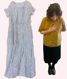
オールドマンズテラー 大人の春夏コレクション

大人気のリネンワンピースや新素材でクラシカルな黒を表現したスカートなど。レトロモダンなデザイン登場!