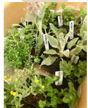
信州うらさとハーブ園の育てやすいハーブ苗 350円~販売します。

春をスキップして季節は初夏に。 心晴れやかとはいかない昨今、英 国の服や雑貨で少しだけ気分転換し て下さいませ。連休の英国展でご紹 介したかったアール・デコ香るロン ドン発のヴィンテージドレス、ブラ ウス。オールドマンズテーラーより 軽やかなリネン服も届きました。 英国カメリアズテイーハウスから は、グレートテイストアワード受賞 の缶入り紅茶群が初入荷。ハーブ苗 や Terakado のレモンケーキもご用 意して、のんびり皆さまをお待ちし ております。