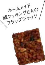
ホームメイド 蔵クッキングさんの フラップジャック