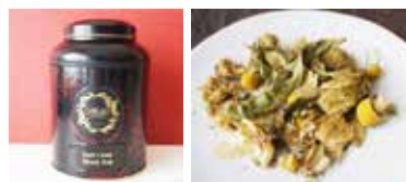
英国カメリアズの缶入り紅茶と金賞受賞スリーブウエル (ロンドン)