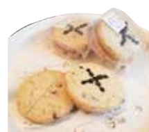
mayさんのお菓子、 人気のお菓子他いろいろ出ます