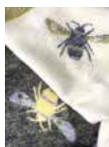
ヨークシャーの 新作ブランケット

会場 吉祥寺よろず屋「The Village Store」 住所 東京都武蔵野市吉祥寺本町2-18-7 1階北側 お問い合わせ ☎ 03-3352-8107 (MP編集部) ✉ taguchi@mrpartner.co.jp