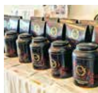
カメリアズ・テイー・ハウス