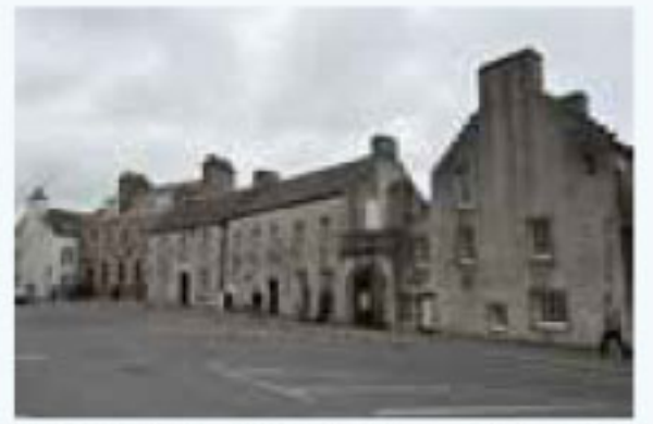
先史時代からの歴史あるオークニー諸島の素朴な町並み。