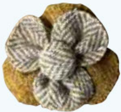
ツイードの生地で作られた手づくりブローチも。