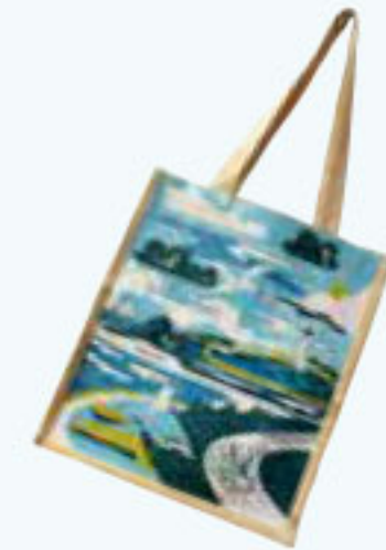
オークニー製のキラキラボタン。ニットに縫い付けるだけで、ラブリー! 島のジュートバッグも入荷です。