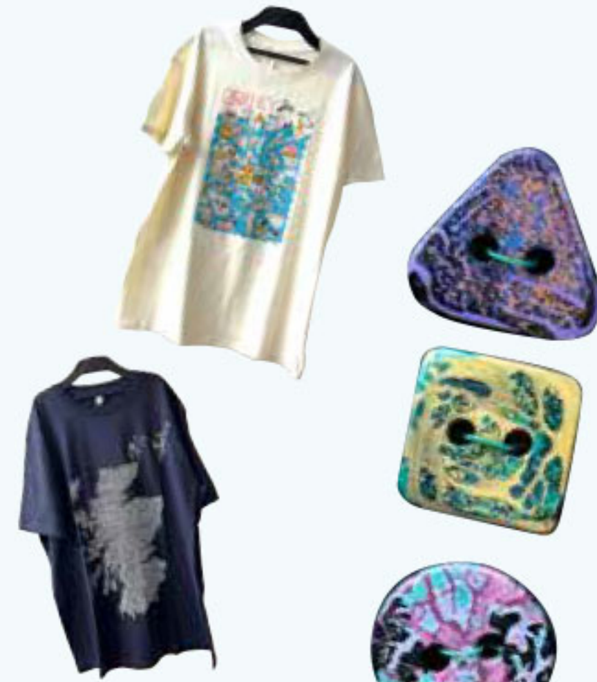
スコットランドの地名が描かれたコットンのTシャツ。