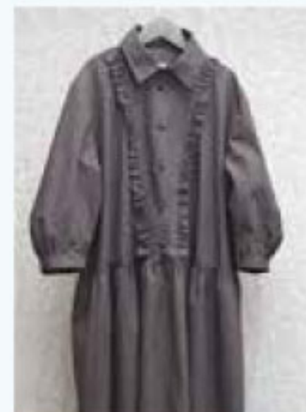
ギャザーフリルが印象的なコットン生地の英国製ワンピースが限定数。