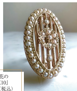
『パールの花の フローチ K10』 302,500円(税込)

石の繊細で美しい輝きを活かしたどこかアンティークな雰囲気があるオリジナルジュエリー。それらは、依頼を受けてから丁寧に作り上げるといふ。 シルバークの製造会社に10年ほど従事していた武田さんは、自身の知識や技能が業界内でも通じるのかと疑問を感じ、名古屋の某彫金教室に通い始める。彫金教室に併設されていたアトリエのスタッフや師匠の仕事ぶりに感化されて弟子入りし、現代の名工と黄綬褒章を受章した師匠の元で、約10年余りハイジュ