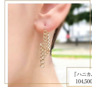
「ハニカムピアス K10YG」 104,500円(税込)

く、個人の気持ちや思い出も込めるものになった。現在でもヨーロッパでは大切な子どもや孫が財産としてジュエリーを受け継いでいく文化が根付いている。「本物のアンティークジュエリーは、今でも残っています。技術は今の方が進歩していますが、デザインは昔のジュエリーの方が洗練されています。アンティークジュエリーをできるだけ、今の技術で作れるものに落とし込んで、資産家だけではなく、もっと多くの方が手にできるようになれたらと思っています」