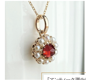
「アンティーク調ラウンドペンダント ガーネット/パール K10」 67,100円(税込)

ジュエリーの本場であるヨーロッパでは、家宝になり得るほど大事にされている。アンティークジュエリーとしては、最高峰と名高いヨーロッパの王侯貴族時代、とくに英国のエドワードアンジュエリーやヴィクトリアンジュエリーが有名であるが、この他にも権力や富の象徴として、数々の繊細で優美なジュエリーが生まれた。漆黒の宝石「ジエット」を使用した故人を偲ぶ服喪用の装身具「モーニングジュエリー」や死者への愛情を表現した「愛する人との永遠の愛を誓うセンチメンタルジュエリー」の登場により、富や権力の象徴だけではなく、