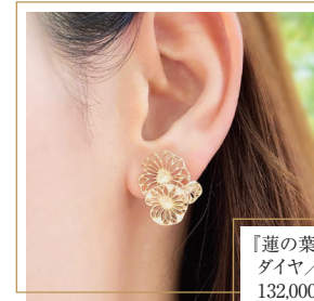
「蓮の葉のピアス 3枚葉 ダイヤモンド/K10YG」 132,000円(税込)

高い技術、そしてお客様の想いや要望にしっかり応えてきた経験から、個人の依頼だけでなく業者やデザイナーからの依頼も無い込んでいます。「新規の依頼もどんどん受けて行きたい」と意欲を語る武田さんに今後の展望について伺った。「今は、電話やインスタグラム、LINEで依頼をお受けしている状態で店舗は持っていません。今後、直接お客様とお会いしてお話したり、打ち合わせしたりできる店舗やアトリエのような場所を持ってたらと考えています」