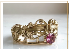
『ピンクトルマリンの ロココ調リング K18』 222,200 円(税込)