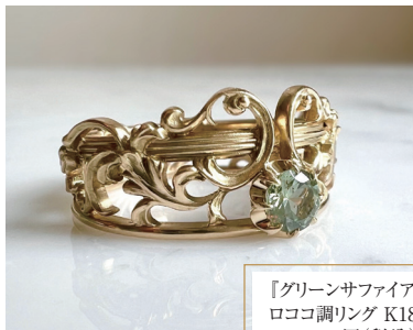
『グリーンサファイアの ロココ調リング K18』 217,800 円(税込)