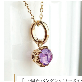
「一個石ペンダント ローズカット アメシスト K10」 39,600円(税込)

ジュエリーの本場であるヨーロッパでは、家宝になり得るほど大事にされている。アンティークジュエリーとしては、最高峰と名高いヨーロッパの王侯貴族時代、とくに英国のエドワードアンジュエリーやヴィクトリアンジュエリーが有名であるが、この他にも権力や富の象徴として、数々の繊細で優美なジュエリーが生まれた。漆黒の宝石「ジエット」を使用した故人を偲ぶ服喪用の装身具「モーニングジュエリー」や死者への愛情を表現した「愛する人との永遠の愛を誓うセンチメンタルジュエリー」の登場により、富や権力の象徴だけではなく、