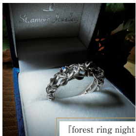
『forest ring night Pt900/ ロイヤルブルームーンストーン』 211,200円(税込)

エリー製作やアンティークジュエリーの修理などに携わり、本格的に宝飾の貴金属装身具製作の道へと進んだ。その後、独立、2020年オーダーメイドジュエリーやオリジナルジュエリーを製作する『Stamour Jewellery』を設立する。 ものづくりにおいては、技術の高さに目が行きがちだが、技術は「感性」を「形」にする手段にしか過ぎない。技術が高く、感性を形にするための引き出しが多ければ多いほど理想に近いものができあがる。