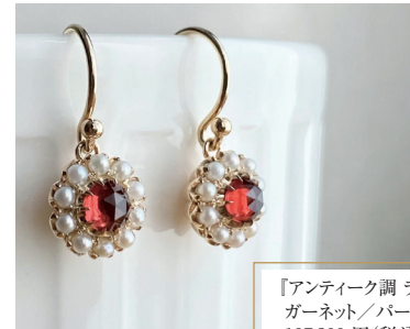
「アンティーク調 ラウンドピアス ガーネット/パール K10」 107,800円(税込)