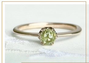
『一個石リング ローズカット ペリドット K10』 41,800円(税込)