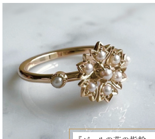
『パールの花の指輪 K10』 105,600円(税込)

「自分が作りたいという気持ちや感性は、目には見えないものなので、自分が持っている技術で目に見えるように形にしておく作業は楽しいものです」 日本におけるジュエリーは、資産家が身につける贅沢品のような印象が強いが、気軽に楽しんで貰えるようにとできるだけでなく、シンプルな作りのカジュアルジュエリーも多く出回る。決してそれが悪いわけではないが、武田さんは「ジュエリーは気持ちを込めて大切に作るもの」という想いを大切にしている。