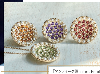
「アンティーク調colors Pendant K10/ペリドット/パール」 158,400円(税込)