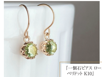
「一個石ピアス ローズカット ペリドット K10」 36,300円(税込)