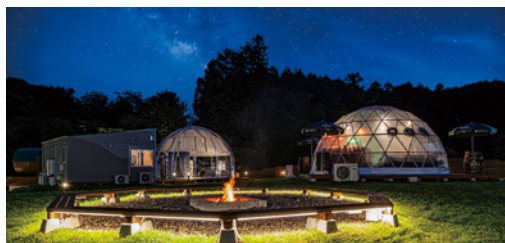
今人気のグランピング (B&V那須高原)

ほかにも、観光資源の整備や文化芸術活動の支援、生涯スポーツの推進など町全体の活力と魅力を高めるための施策にも幅広く活用。誰もが安心して暮らせる、やさしさに包まれた町づくりを実現している。