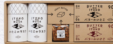
『選べるバターのいとこ詰め合わせ』 (バターのいとこ2種類、 ラスク2種類、グラノーラ) 寄付金額 15,000円