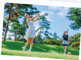
那須カントリークラブ