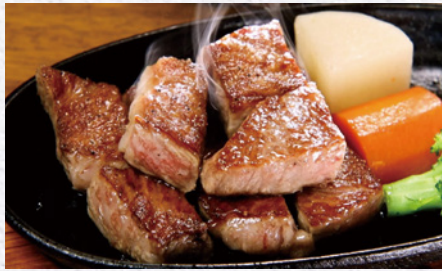
『ステーキハウス寿楽 お食事・お買い物券』 寄付金額 10,000円～