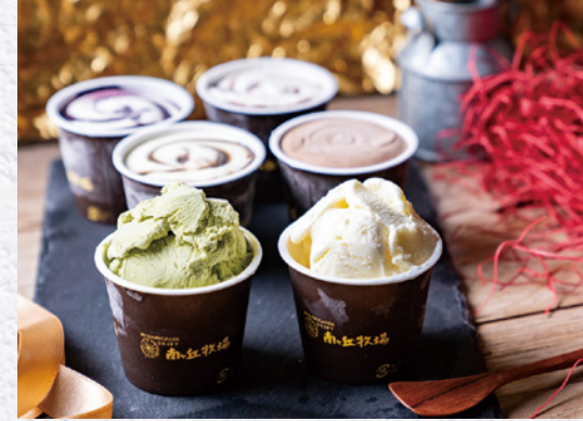
『南ヶ丘牧場アイスクリーム12個』 寄付金額 19,000円