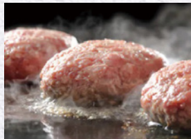
『やみつきハンバーグ』 寄付金額 6,000円～