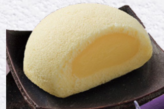
『御用邸の月10個』 寄付金額 6,000円