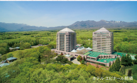
『那須温泉旅館協同組合ご宿泊利用券』 寄付金額 10,000円～