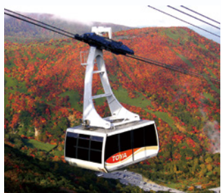
那須 ロープウェイ