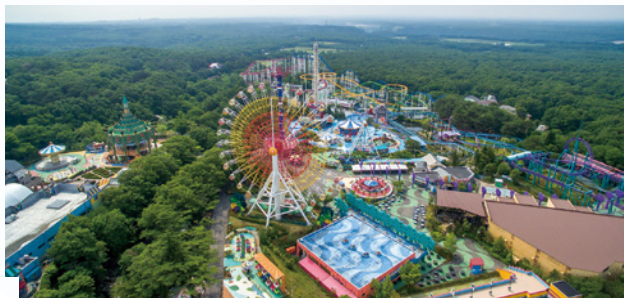
那須ハイランドパーク