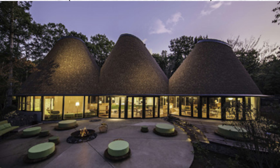
『星野リゾートトリブナーレ那須宿泊ギフト券』 寄付金額 56,000円～