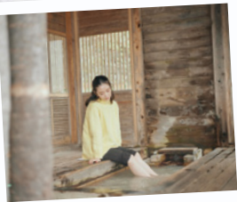
那須湯本足湯 『こんばいの湯』