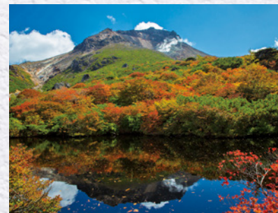
茶臼岳(秋の姥ヶ平)

菜の栽培も盛ん。道の駅「那須高原友愛の森」には、地元食材を活かした農村レストランもオープンし、地域のにぎわいの拠点になっている。