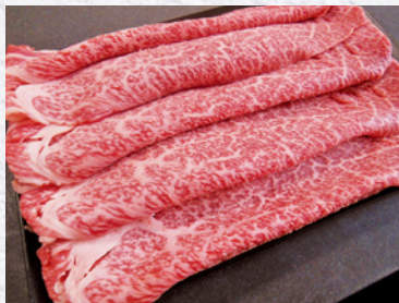
『那須和牛 (すき焼き・ しゃぶしゃぶ用)』 寄付金額 10,000円～