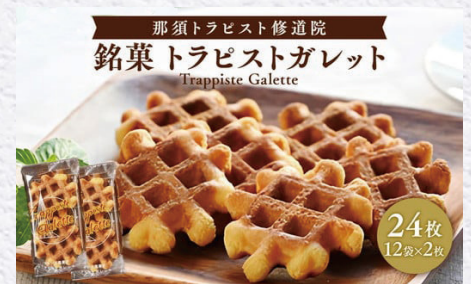
『トラピストガレット』 寄付金額 5,000円