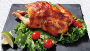
『自家製ローストチキン』 寄付金額 7,000円