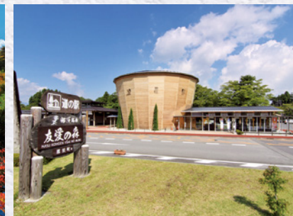
道の駅「那須高原 友愛の森」