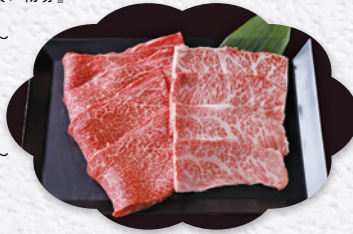
『那須和牛 (焼肉用) 寄付金額 10,000円～