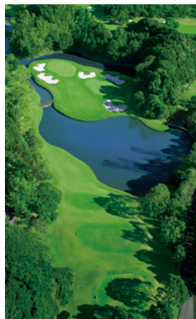
山名コース17番ホール