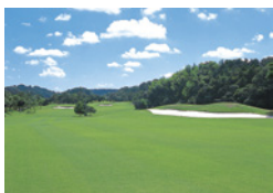
宇刈コース17番ホール