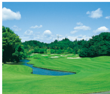
山名コース12番ホール

広いゴルファーを満足させてくれる。特に、多くのゴルファーを魅了する山名コースは、JLPGAツアー「ヤマハレディーズオープン葛城」の舞台にもなっている。『北の丸』宿泊者に限り、「葛城ゴルフ倶楽部」の会員同伴なしでビジターとしてプレーが可能。伝統と自然が織りなす至福のゴルフ体験を味わえる。