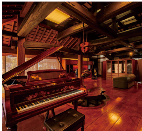
グランドピアノ「YAMAHA C3 Centennial」

広いゴルファーを満足させてくれる。特に、多くのゴルファーを魅了する山名コースは、JLPGAツアー「ヤマハレディーズオープン葛城」の舞台にもなっている。『北の丸』宿泊者に限り、「葛城ゴルフ倶楽部」の会員同伴なしでビジターとしてプレーが可能。伝統と自然が織りなす至福のゴルフ体験を味わえる。